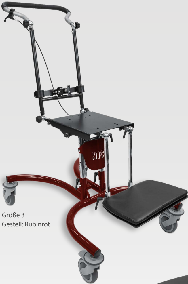
Größe 3 Gestell: Rubinrot