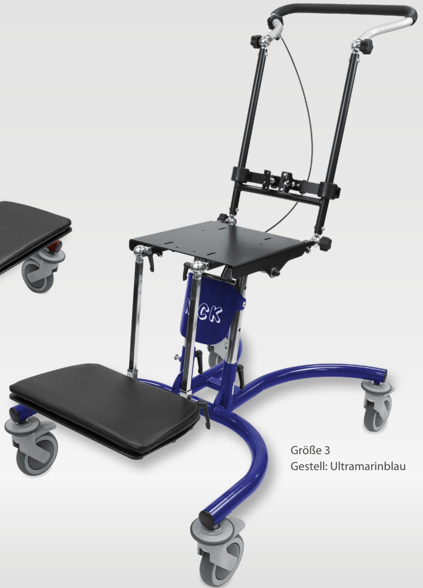
Größe 3 Gestell: Ultramarinblau