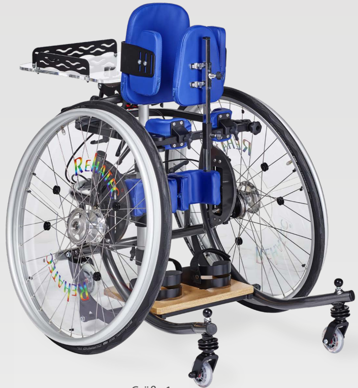
Größe 1 Bezug: Skai Blau Atoll Gestell: Graphitschwarz matt