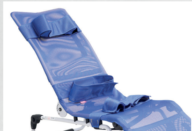
Kopfpolster, Becken-/Rumpfgurt & Beinführungen

Die Rückenverstellung kann bei Gr. 3 und 4 sehr einfach mit einer Hand bedient werden.