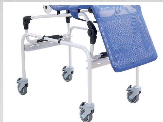
Melody mit Duschgestell, fahrbar

Das Badewannengestell sorgt für eine optimale Höhe beim Abduschen in der Badewanne.