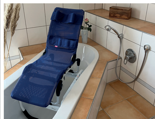
Melody mit Badewannengestell

Das Badewannengestell sorgt für eine optimale Höhe beim Abduschen in der Badewanne.