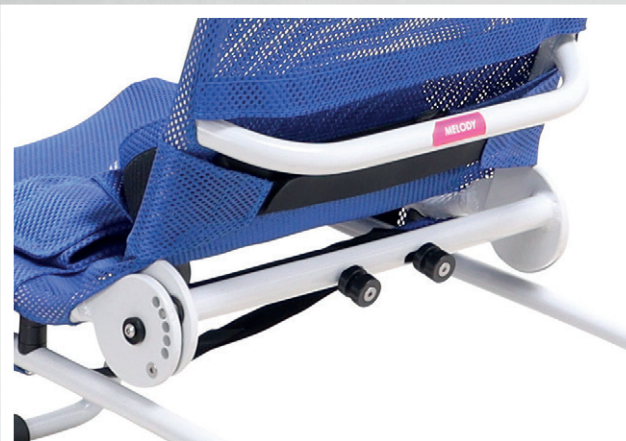
Rückenverstellung Gr. 3 und 4

Mit dem fahrbaren Duschgestell ist ein anwenderfreundlicher Transfer im Nassbereich sowie das Duschen in bodengleichen, barrierefreien Duschen möglich.