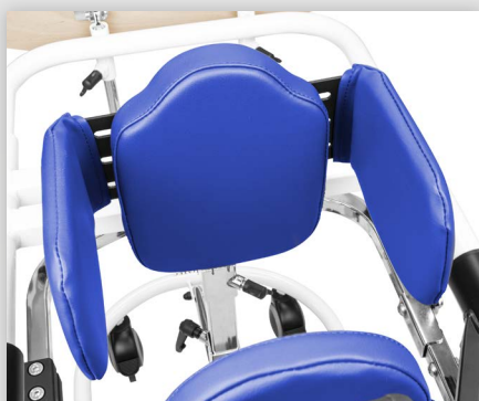
Brustpelotte Sternum, verstellbar