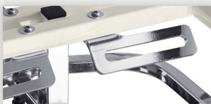
Befestigungsösen für Stehorthesen