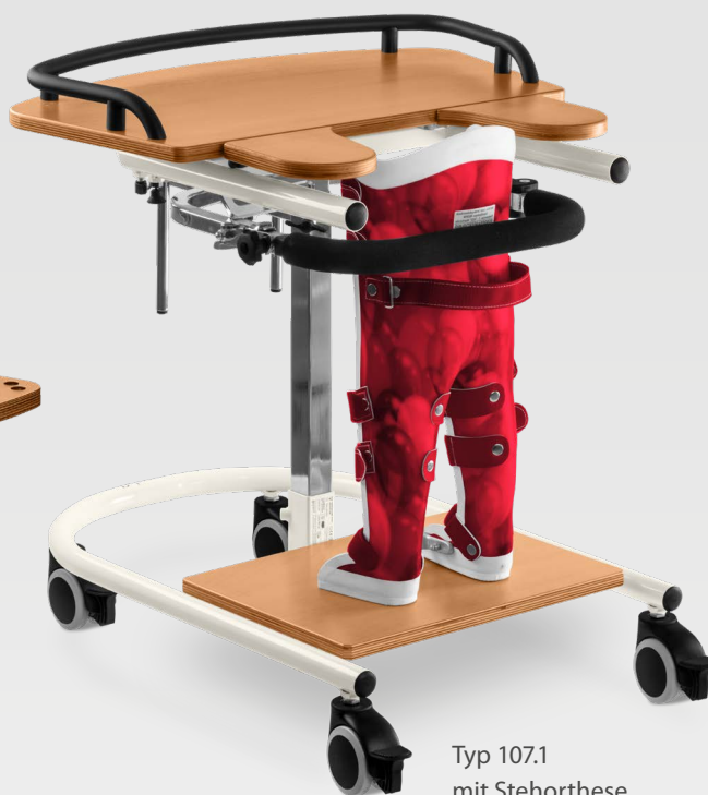
Typ 107.1 mit Stehorthese Gestell: Reinweiß