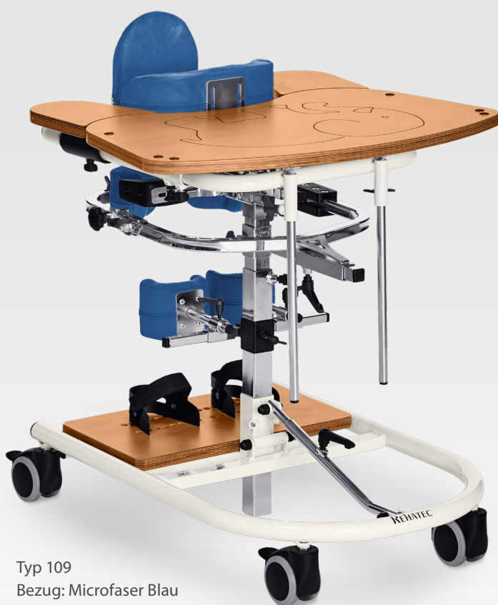
Typ 109 Bezug: Microfaser Blau Gestell: Reinweiß